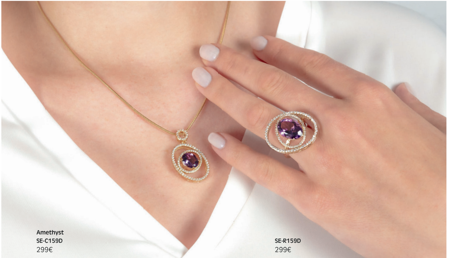
Amethyst SE-C159D 299€