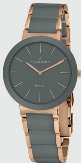
42-7M 149€ statt 249€