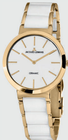
1-1999D 129€ statt 199€