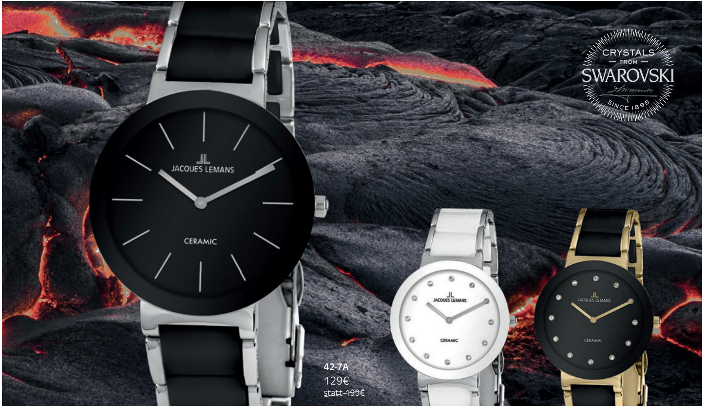
42-7A 129€ statt 199€