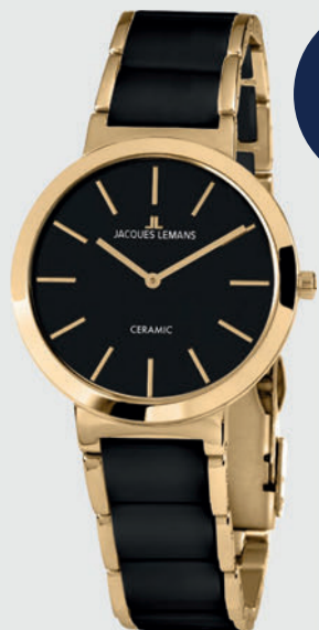
1-1999C 129€ statt 199€