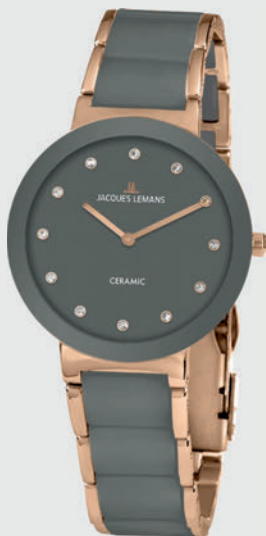
42-7N 149€ statt 249€